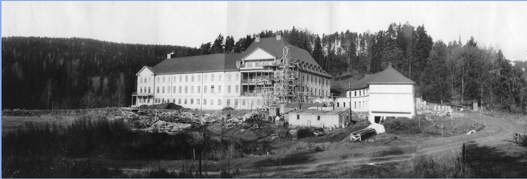
Opprinnelige Radiumhospital fra 1932 (venstre) og tilbygg for forskning og Kreftregister (høyre)

Allerede før Radiumhospitalet ble etablert i 1932, ble det foreslått å etablere et kreftregister. Men det var først etter krigen at denne tanken ble til konkrete planer. Det naturlige sted å legge registeret var Radiumhospitalet. Sykehusledelsen den gang mente at Radiumhospitalet skulle ha 3 fundamenter for sin framtidige aktivitet: Pasientbehandling, forskning og et kreftregister. Et slikt register skulle overvåke kreftsykdommen i samfunnet med tanke på mulige tiltak.