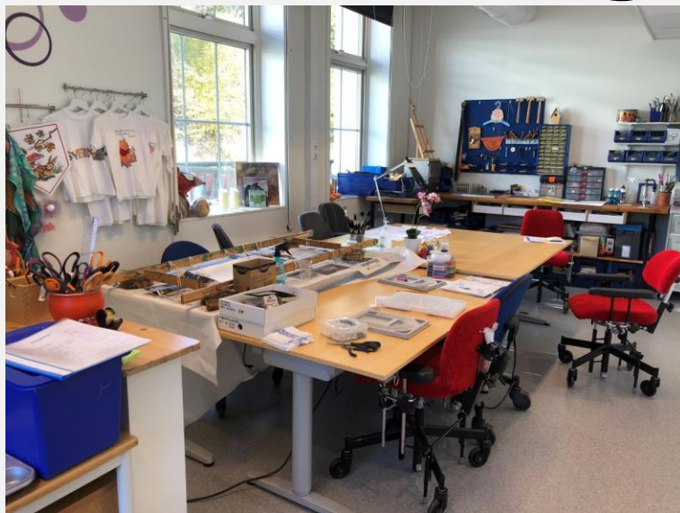
Aktiviteket i 2022