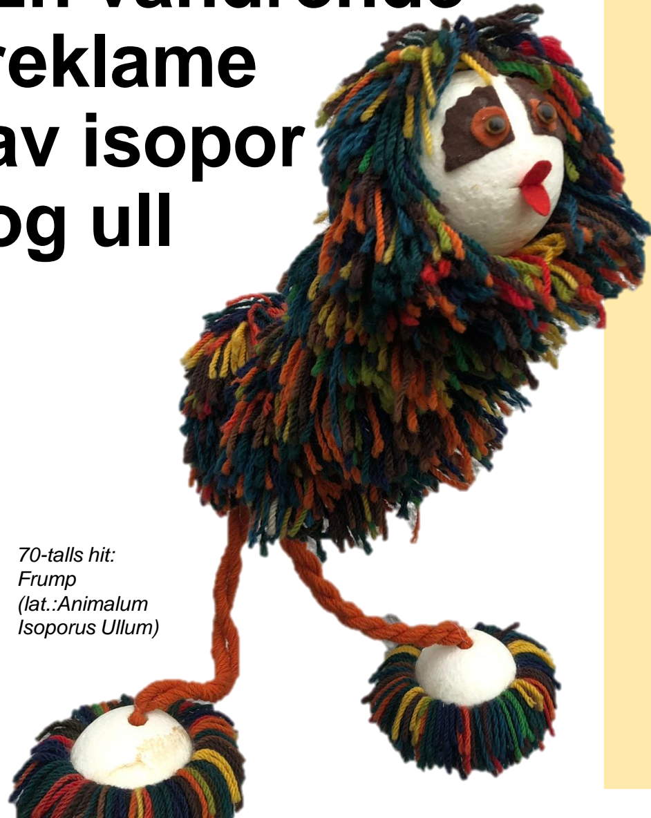
70-talls hit: Frump (lat.: Animalum Isoporus Ullum )