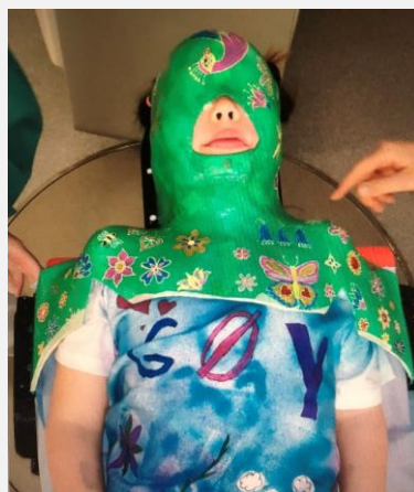
Gøy å være på Aktiviteket og male masken sin!

Fra 2014 er det blitt 1,8 stillinger. Ikke mange, men nesten en dobling fra starten i 1976!